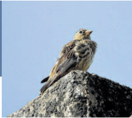
Un gorrión chillón.